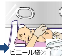
⑥排便があった場合 はオムツで便を包 み込むようにする。 おしりふきでお尻 を拭く。おしりふ きはビニール袋② に入れる。