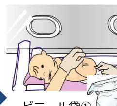
⑤汚染したオムツ を丸めてビニール 袋①に入れる