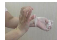
⑦手袋を外し ビニール袋 ②に入れる