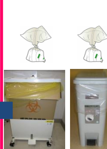
⑫保育器からビニール袋を2つ取り 出しビニール袋を閉じ、オムツ の計測を行い、ゴミ箱に廃棄す る