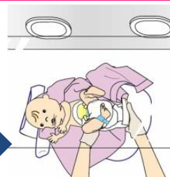
④ポジショニング マットを外し、お 尻の下に新しいオ ムツを開いて入れ る